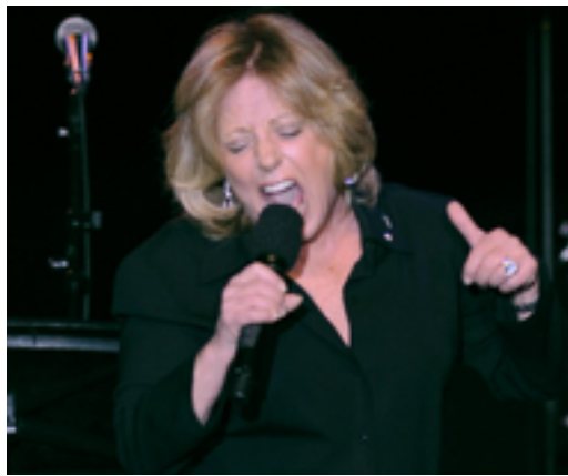
Ecouter Lesley Gore